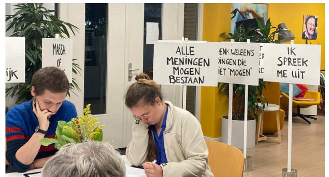
Het publiek vult de vragenlijst in.

Stut theater is benieuwd wat het publiek vindt van hun voorstellingen. Daarom heeft Stut aan Meetellen gevraagd om een publieksonderzoek uit te voeren. We gaan bij verschillende locaties langs met een vragenlijst. De animo om die in te vullen was tot nu toe groot. Verschillende mensen kwamen na de voorstelling zelf naar ons toe om te vragen of ze mee mochten doen en een keer hadden we zelfs vragenlijsten te kort! De afnames lopen nog door tot december, daarna stelt Meetellen een mooi rapport op.