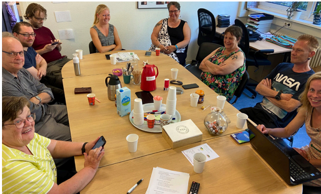
Panelleden testen receptenkaartjes voor het Voedingscentrum

Welke gerechten kun je maken met broccoli en hoe smaakt venkel? Het Voedingscentrum ontwikkelt receptenkaartjes om Voedselbankbezoekers te inspireren. Meetellen panelleden beoordeelden de kaartjes en gaven waardevolle feedback. De placemats met voedingsweetjes voor Resto van Harte kregen gemengde reacties. Sommigen vonden ze leuk, anderen betuttelend.