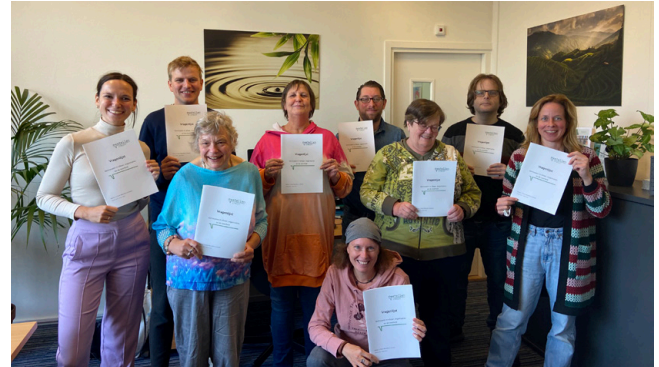
Trots op de nieuwe vragenlijst!