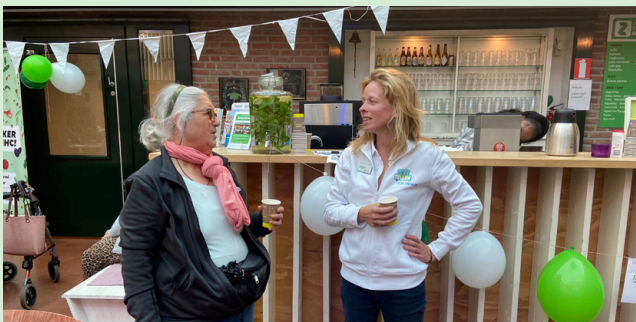
Een ontspannen sfeer waarin we elkaar beter leren kennen