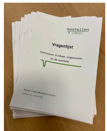
Dit is hem, de nieuwe vragenlijst!

Uiteindelijk werd de vragenlijst uitgebreid tot het thema: 'Vertrouwen in elkaar, organisaties en de overheid.' Nu is hij af en gaan we ermee op pad in de stad. Binnenkort ontvangen jullie de vragenlijst, per post of per email. We hopen natuurlijk dat een groot aantal van jullie hem weer in gaat vullen! Want hoe meer mensen meedoen, hoe luider jullie stem klinkt.