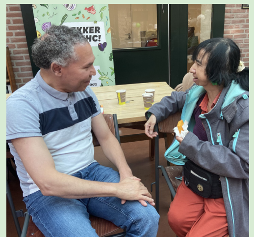
Tijdens de pauze bevragen panelleden elkaar over hobby's en hun buurt