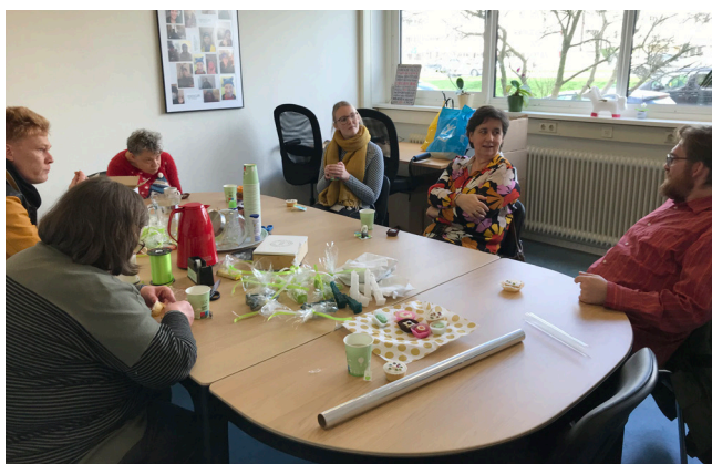
nader kennismaken met het team

Doordat de onderzoeken en factsheets gelezen worden, is Meetellen een belangrijke partner geworden voor de gemeente. De adviezen van Meetellen zijn bruikbaar en worden ook meegenomen in het beleid. Dat kan soms niet zo snel als we willen.