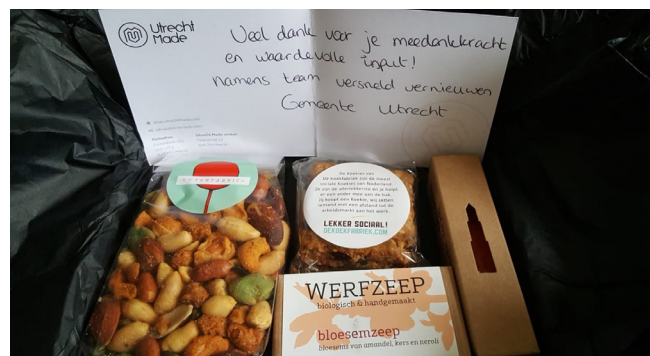
we kregen zelfs een leuk bedankje toegestuurd

De gemeente heeft ons verschillende vraagstukken voorgelegd. Hier hebben wij met z'n allen goede gesprekken over gevoerd en gedachten over uitgewisseld. Zoals, wat is er nodig naar aanleiding van de effecten van corona, wat vinden wij van het totaalbeeld van de subsidie aanvragen en zijn de aanvragen vernieuwend genoeg? Zal dit op langere termijn ook een goede investering zijn? Hierin viel ons op dat meeste partijen over het algemeen hulp bieden aan jongeren en ouderen. Ook zijn er weinig "kleinere" partijen die aanspraak hebben gemaakt of kunnen maken voor deze subsidieregeling. We spraken over eventuele samenwerkingen tussen verschillende partijen en wat de gemeente hierin kan betekenen. Kortom, interessante onderwerpen waar Meetellen aan bij kan dragen met input en adviezen en wij onze doelgroepen weer wat meer op de kaart kunnen zetten.