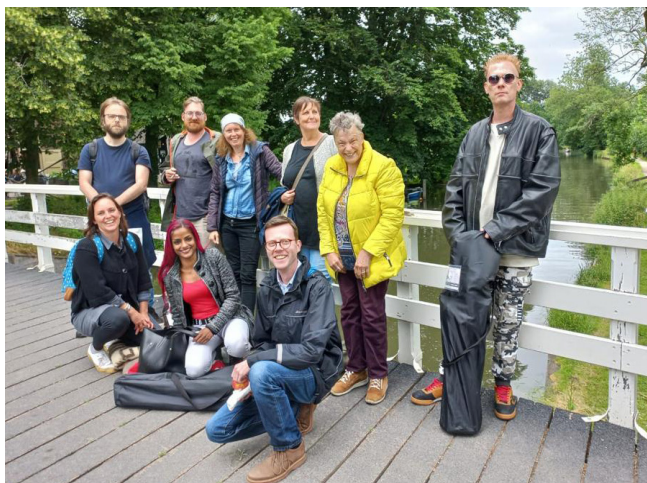
het Meetellen team

Woensdag 23 juni hadden we een gezellige picknick met ons team van panelmedewerkers en 'onze' twee onderzoekers van de gemeente. In het mooie Amelisweerd hadden we een lekkere lunch van 'De Veldkeuken'. Na de lunch speelden we twee leuke kennismakingsspellen om elkaar nog wat beter te leren kennen. Het was een heel geslaagde middag!