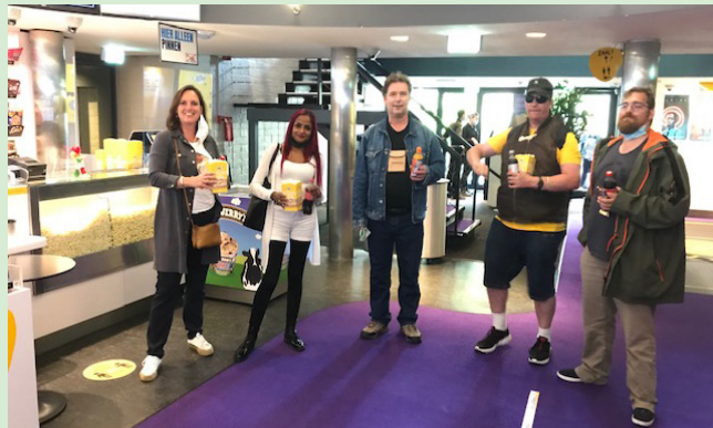
naar de bioscoop

Eind 2020 hadden we een actieweek; panelleden die meededen met de actieweek prijsvraag over Meetellen konden een uitje winnen. Door corona duurde het even, maar in juli gingen twee uitjes door: naar de bioscoop en op een sloep door de grachten. Er staan nog een paar uitjes op stapel. We kijken ernaar uit! In de volgende nieuwsbrief meer daarover.