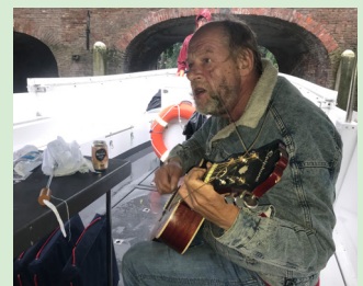
met de prijswinnaars in een sloep over de grachten van Utrecht, panellid Gerard vermaakt ons met muziek