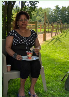
Samen genieten van een mooie dag!