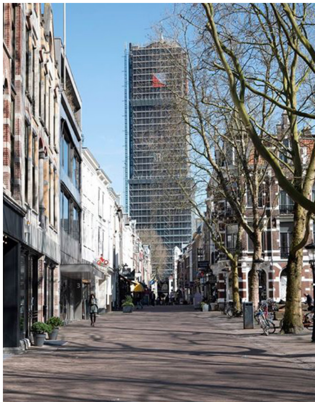
Leeg Utrecht