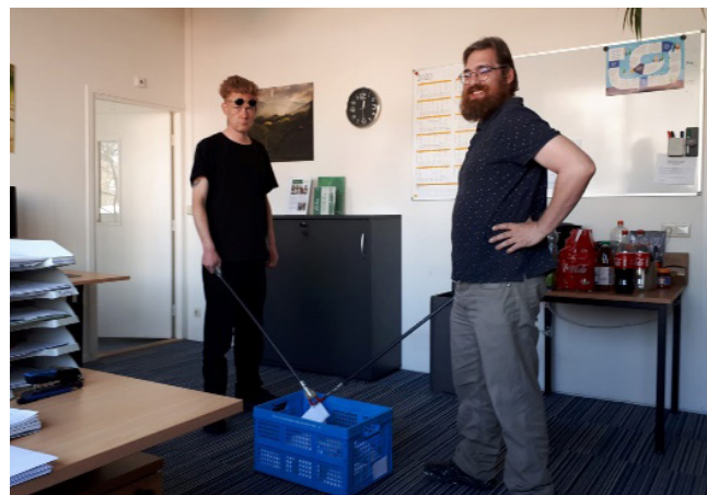
De trekking van de winnaars in coronatijd

We zijn ook benieuwd naar jouw verhaal. Wil je het delen? Stuur het naar utrecht@meetellen.nl met een mooie passende foto erbij! Dan plaatsen wij dat weer op Facebook en onze website.