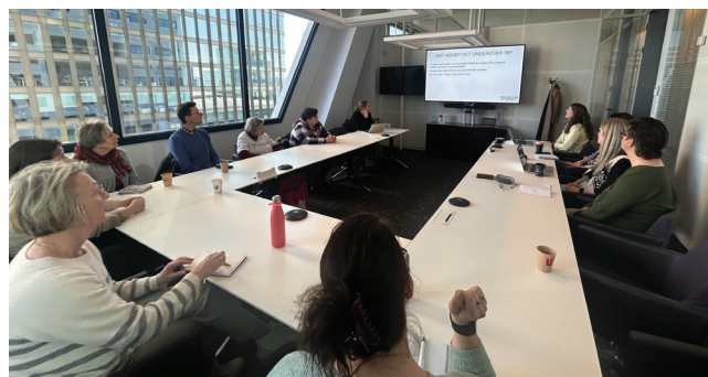
We schuiven aan en gaan in gesprek op het Stadskantoor