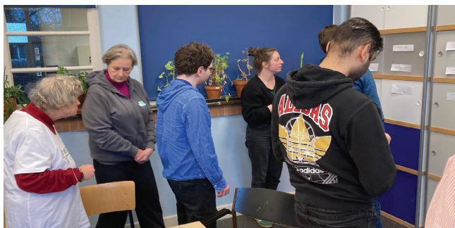
Aan de slag! Alle deelnemers mogen hun mening geven over de stellingen van de onderzoekers