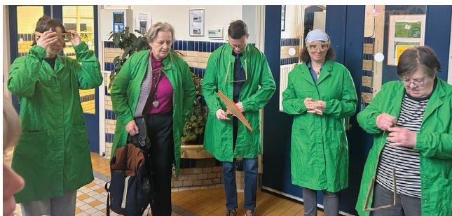
Labjasjes aan en het spel kan beginnen!

Daarna gaan we in gesprek met de ervaringsdeskundige en de trainers. We bekijken een filmpje over hoe iemand erachter komt dat hij LVB heeft. Ook leren we bij het maken en bespreken van andere opdrachten hoe je het beste met mensen met LVB kunt omgaan. De belangrijkste les? Ieder mens is uniek. Er is geen standaardoplossing; iedereen heeft iets anders nodig om zich prettig te voelen. De sfeer is goed en de training is heel fijn opgezet. We gaan met een positief gevoel naar huis. We raden deze training aan iedereen aan die hier meer over wil leren.