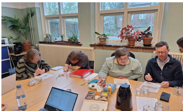
In tweetallen bekijken we elk woord met aandacht