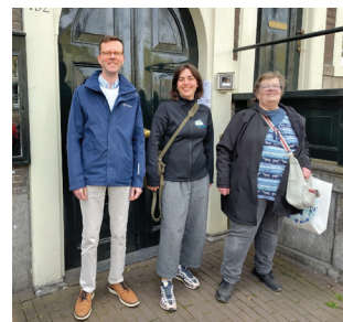
We zijn trots om hier namens Meetellen te mogen zijn in Amsterdam

In de ruimte voel ik dat we allemaal aan hetzelfde doel werken: mensen met ervaringen rond psychische problemen, verslaving, misbruik of geweld zien als onmisbaar! Allemaal zetten wij deze ervaringen in om mensen te ondersteunen, verbinding te creëren en zorg menselijker en beter passend te maken.