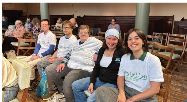
We kijken enthousiast mee vanaf de eerste rij!