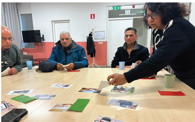
Deelnemers leggen kaartjes bij de foto's

In de klankbordgroepen gebruiken we kaartjes waarop een foto te zien is. Dit zijn bijvoorbeeld kaartjes van een brief, sociale media of de huisarts. De deelnemers laten een groen kaartje zien als ze dit een fijne manier of plek vinden om informatie te ontvangen over vervoersregelingen. Als de deelnemers een rood kaartje laten zien is dit geen fijne manier of plek. Het waren twee hele leuke, leerzame en gezellige klankbordgroepen!