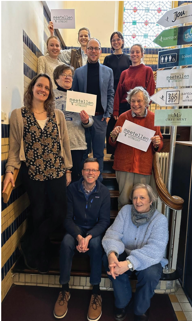
We kijken terug op een waardevolle ontmoeting