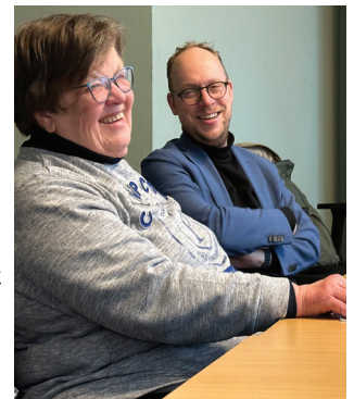
Een warm welkom op De Wilg

Dat hij Meetellen heeft ont houden wordt een paar weken later duidelijk. Niet als wethouder in Utrecht, maar vanuit zijn nieuwe functie als staatssecretaris vroeg hij de Belastingdienst contact op te nemen met Meetellen. Hij vindt dat de brieven van de Belastingdienst beter leesbaar moeten worden.