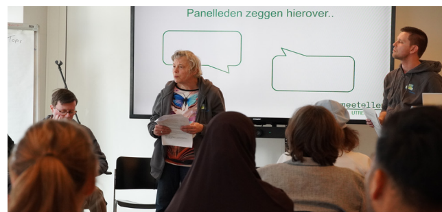
Corrie aan het woord

Ons onderzoek naar vertrouwen blijft de aandacht trekken. De afgelopen maanden hebben we onze bevindingen gepresenteerd aan de gemeente en waardevolle gesprekken gevoerd over vertrouwen. Onze gesprekspartners waren medewerkers van de afdelingen Werk & Inkomen en Volksgezondheid (de afdeling van onze onderzoekers).